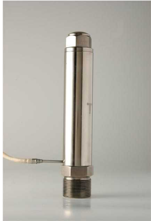
Homogenizador c/ filtro